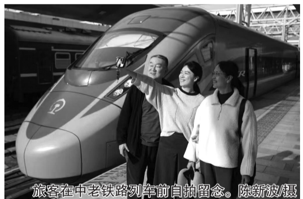
旅客在中老铁路列车前自拍留念。

增至最高18列。截至目前，已有来自120多个国家和地区的78万名旅客通过中老铁路开启跨境旅行。(浦超)