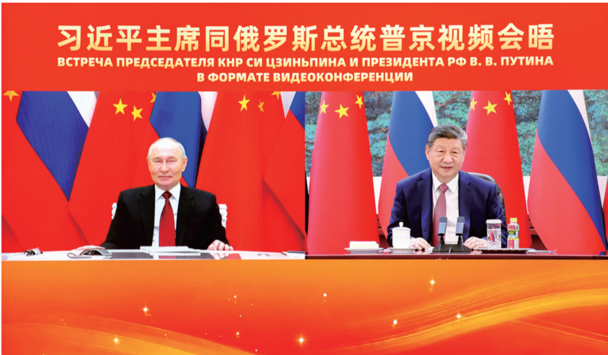
2月4日下午，国家主席习近平在北京人民大会堂同俄罗斯总统普京举行视频会晤。

新华社北京2月4日电 2月4日下午，国家主席习近平在北京人民大会堂同俄罗斯总统普京举行视频会晤。