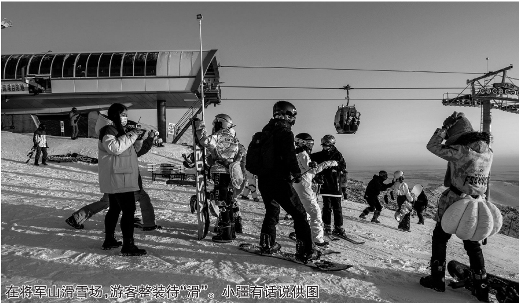
在将军山滑雪场,游客整装待“滑”。

“新疆是开放的,新疆也是热情的。”自治区文旅厅旅游推广与对外交流处处长张瑞华表示,我们愿意为海内外的朋友们到新疆旅游提供最大便利,让大家感受真实的新疆,让大家拥抱美丽的新疆。