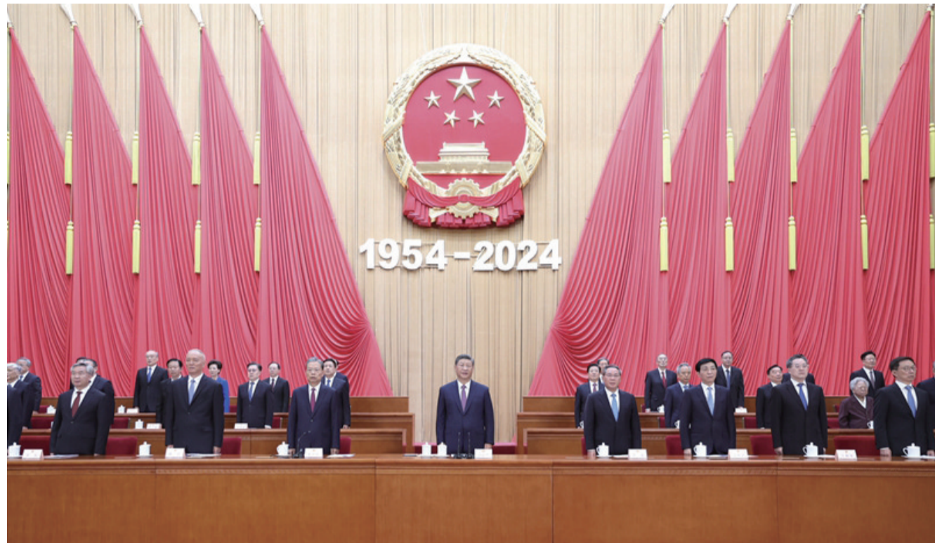
9月14日上午，中共中央、全国人大常委会在北京人民大会堂隆重举行庆祝全国人民代表大会成立70周年大会。中共中央总书记、国家主席、中央军委主席习近平出席会议并发表重要讲话。