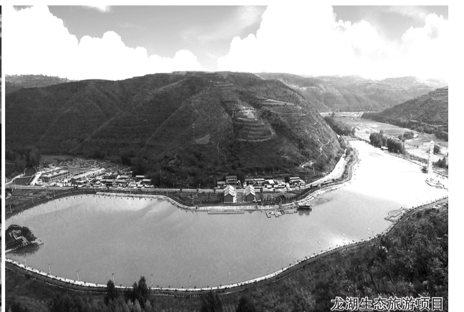
龙湖生态旅游项目

黄龙县位于陕西省中北部、延安市东南缘。区域面积2752平方公里,辖5镇2乡,总人口5万人,境内人口来自全国12个民族24个省区。平均海拔1100米,年平均气温9.4度,年平均降水量561.4毫米,无霜期平均180天。是国家重点生态功能区、国家级马鸡自然保护区、省级天然次生林保护区和全国八大防护林区之一,是一片原生态、纯天然的美称。